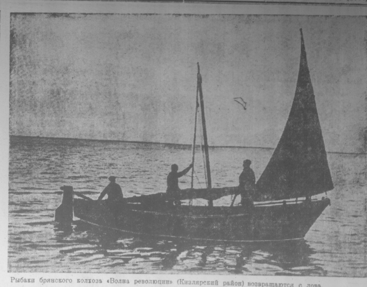
Рыбаки бригского колхоза «Волна революции» (Кизиларский район) возвращаются с лова.

В Марселе прибыл американский паролот с продовольствием и медикаментами.