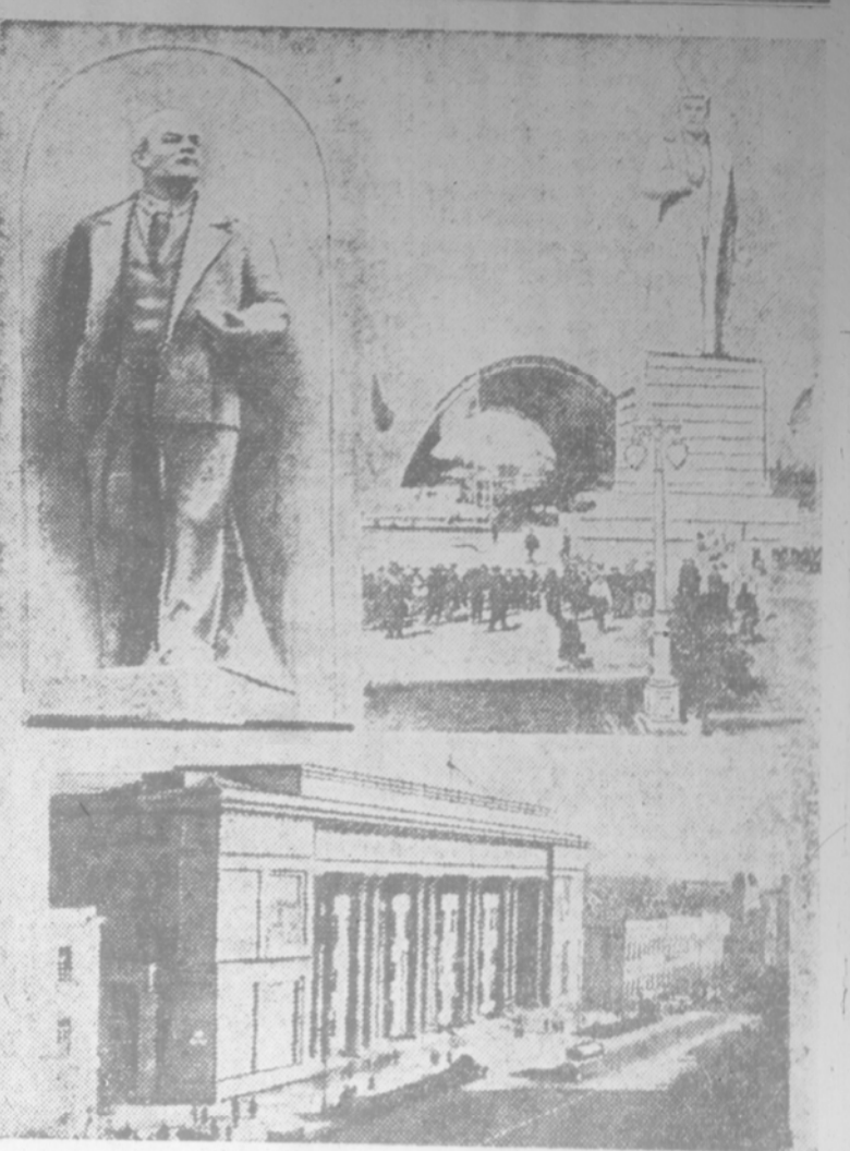
Произведения искусства, авторы которых удостоены Сталинской премии. На снимке (справа налево сверху): скульптурная фигура И. В. Сталина на Всесоюзной сельскохозяйственной выставке и скульптурная фигура В. И. Ленина в зале заседаний Верховного Совета СССР, работы заслуженного деятеля искусств Армянской ССР С. Д. Меркурова, удостоенного за эти работы Сталинской премии первой степени. Внизу: здание Института Маркса — Энгельса — Ленина в г. Тбилиси, сооруженное по проекту академика архитектуры А. В. Шусева, удостоенного за этот проект Сталинской премии первой степени.

Заведующие райо и директоры МТС не ведут должнейшей борьбы с этими бракоделами весеннего сева.