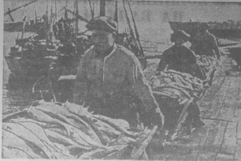
На снимке: отгрузка рыбы на Брянском рыбозаводе (Кизлярский район).

В селах Сергеевского, Спидевского и Башпашар, Спидевского района, закончилась трехдневные семинары агитаторов, едущих на строительство Невинномысского канала. Агитаторы прослушали лекции на разнообразных темах. В. САВЧЕНКО.