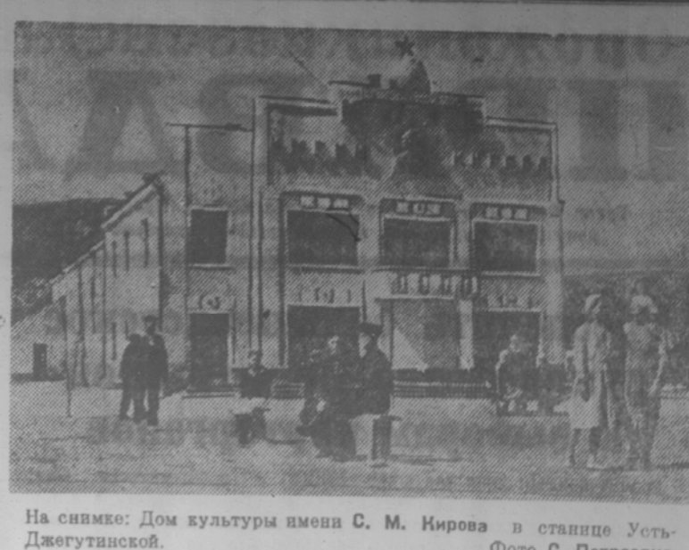
На снимке: Дом культуры имени С. М. Кирова в станции Усть-Джегутинской.

После районных конференций СВБ все пуцено на самотек. П. ДЗАНЕВ.