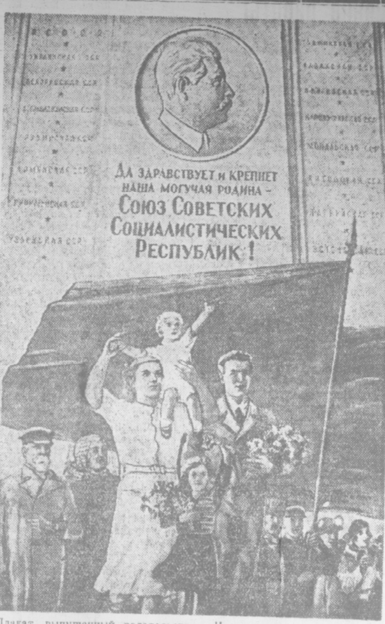
Плакат, выпущенный заводством «Искусство» в 1 мая. (Работа художника Б. Юрлова-Скокого).