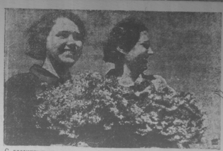
С весенними цветами.

В Восточной Африке ничего существенного не произошло. Самолеты южно-африканской авиации, говорится в английской сводке, совершили вылет на аэродром в Комбейне.