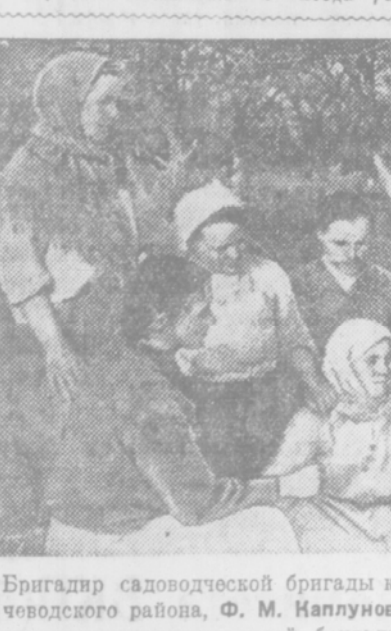
Бригадир садоводческой бригады колхоза «Красный казак»...