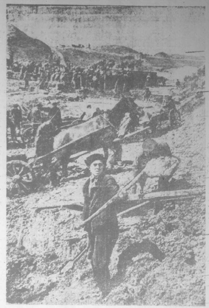
Строительство Невинномысского канала. Колхозники Шаповского района на очистке грунта.