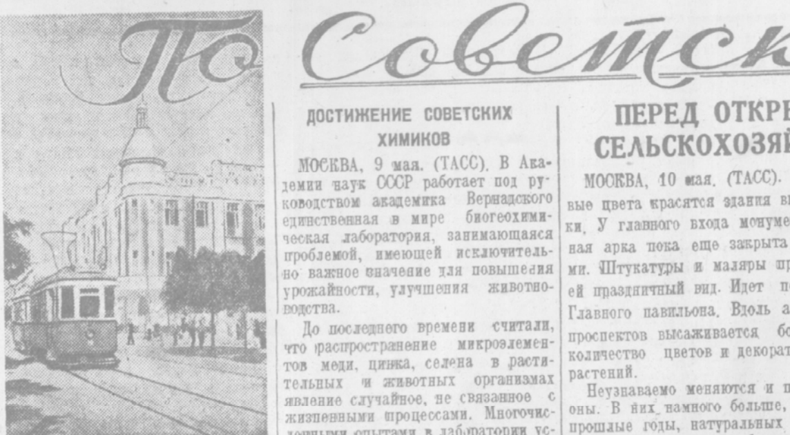
Красная улица в гор. Краснодаре. Слева—здание Краевого ВКП(б).

Северный рейс заканчивается. Остается последний этап: Архангельск—Москва. Понад 22 тысячи километров пути, пролегающего над льдами полярных морей. АРХАНГЕЛЬСК, 10 мая. (ТАСС). Пробывание самолета «СССР Н-169» в Америке было непродолжительным, и отходивший участникам высокоширотной экспедиции не удалось, к тому же пришлось заменять ледяной самолет колесами. Вывоз только «СССР Н-169» отлетел на Архангельский аэродром.