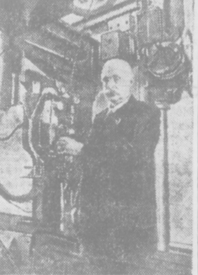
Лауреат Сталинской премии, академик-орденоносца Е. О. Платон у аппарата скоростного автоматического электро-сваривания.

Большое практическое и теоретическое значение имеют собранные тт. Либиним, Острехиным и Черничковским данные о температуре, солёности и напастовании воды различного происхождения на различной глубине. Эти данные дают возможность судить, насколько далеко проникают в центральные районы теплые течения из Атлантического океана, насколько замедляются процессы увеличения толщины ледяного покрова. Магнитные наблюдения астронома-магнитолога М. В. Острехина позволяют уточнить магнитные карты Арктики. До высокоширотной воздушной экспедиции о величине