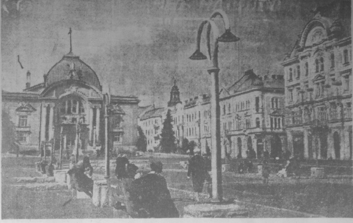
По городам Советского Союза. На снимке: театральная площадь в г. Черновиках. Слева — Украинский драматический театр, справа — Дворец юных пионеров.

В результате 15-дневных забастовок в районе Мугулы (Турция) 3 чел. убито и 8 ранено, разрушено 510 домов и 939 сильно повреждено.