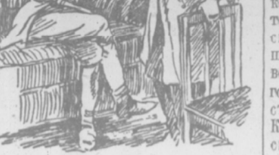
Читай, Барисби, по нашему — ты пишущий русские на этой бумаге. Я хочу знать — чей клад зарыт в горах...