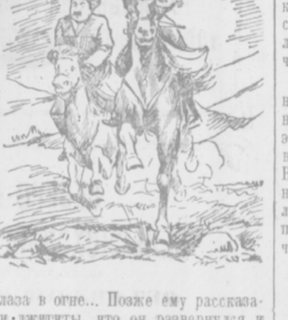
Глаза в огне... Позже ему рассказали джигиты, что он развернулся и с разгону так хлопостузил конюшу аржуба...

Всю ночь шел Анзор по неведомой тропе, сбывая ноги об острые и холодные камни. Каждый шаг ему — злой шагал, казался ветка бука — змея серая, а скалы — черные медведи. Шел Анзор и думал: «Встретит меня сейчас зверь страшный, а я скажу ему тихо: «Не тронь меня, зверь, я маленький кул из Уркунджа...»