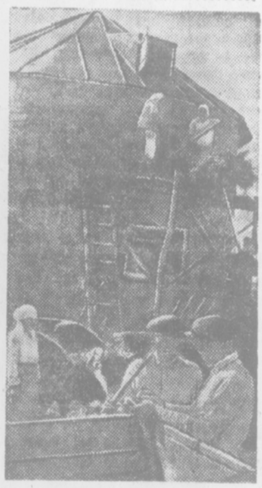
180 тонн силоса заготовили колхозники сельхозартели им. Ворошилова, Ворошиловского района. На снимке: загрузка силосовой ямы.