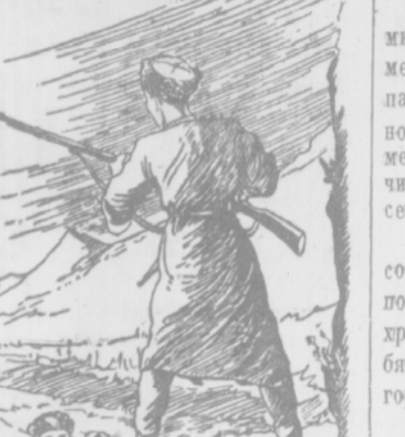
Красным верхом. Анзор стоял на краю обрыва с длинным аржубом в руках. Салам — привет.

Кулы — рабы, бесправные горцы. Бий — князь.