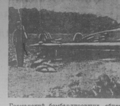
Германский бомбардировщик, сбивший над территорией Англии.

ЛОНДОН, 26 июня. (ТАСС). Как передает английское министерство информации, 150 тысяч человек, в том числе две бронетанковые дивизии, приняли участие в маневрах, происходивших в восточной части Англии на пространстве свыше 2000 квадратных миль. В маневрах приняли участие 20 тыс. человек из отрядов местной обороны и много тысяч рабочих, занятых на оборонных работах. Главнокомандующий войсками метрополии Брук находился в хелем маневров. Присутствовали также американские офицеры. Во время маневров парашюты высадился на аэродром, прорвался в город и захватил старинный замок, который является крепостью. Через два часа после приземления первых парашютистов замок был уже в руках «противника». Отряды местной обороны, защищавшие замок, были захвачены врасплох. В городе возникло «смешение» в связи с сообщениями о захвате замка, но отряды местной обороны притупили к действиям, и через два часа замок был в их руках. В течение трех часов, до прибытия регулярных войск, отряды местной обороны вели «бой». Помысли «противника» захватить город врасплох, высадив морской десант, не удалось. По железной дороге были доставлены к месту «боевых действий» 100 танков, которые были быстро выгружены. Указывают, что маневры в точности изображали операции, которые могут развернуться в случае вторжения германских войск.