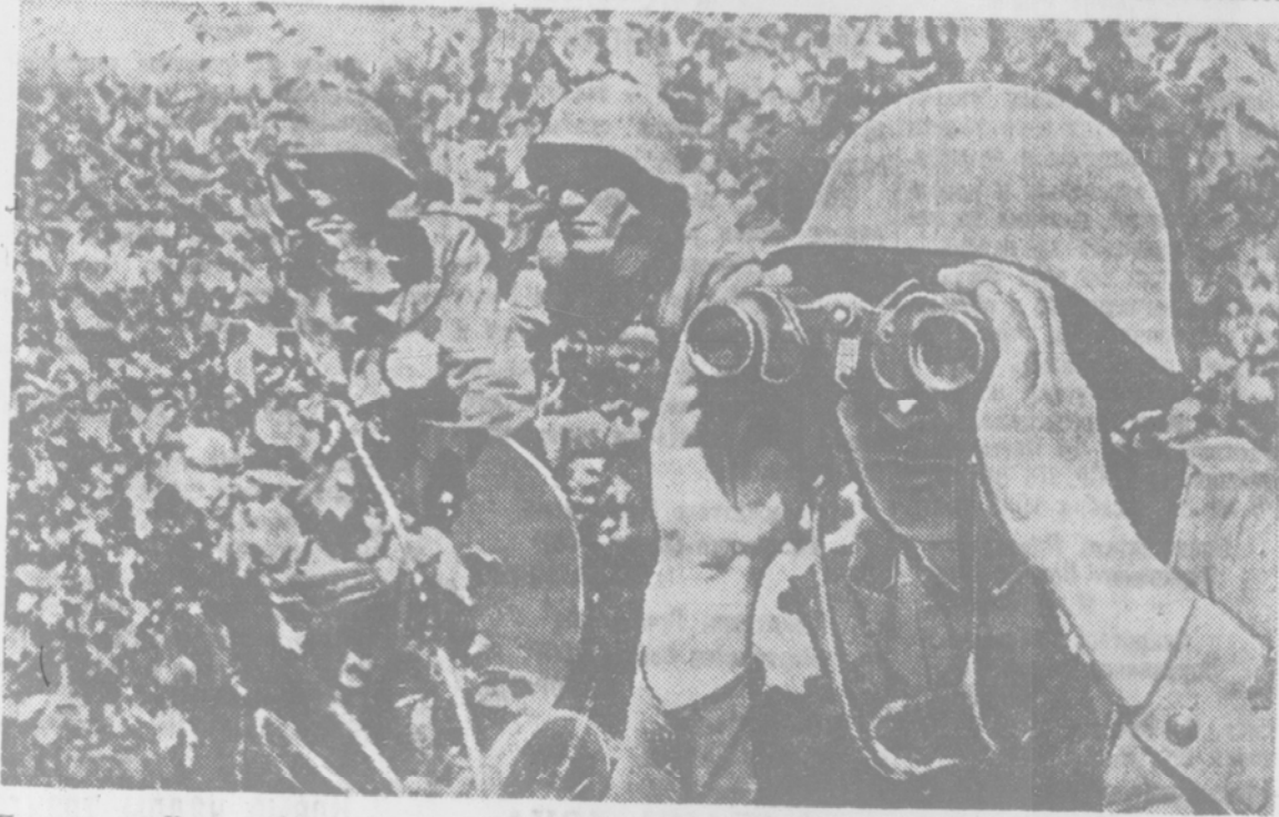
Пулеметчики Красной Армии на линии огня.

М. ДАШЕВСКИЙ. Действующая армия. («Известия», 26 июня).