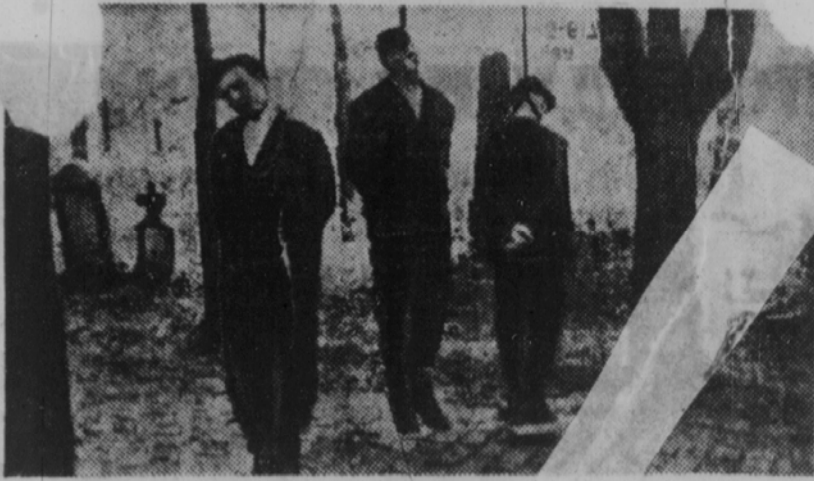
Так расправляются гитлеровские караваны с партизанами-сербам, борющимися против фашистского нашествия в Югославии. (Фото ТАСС).