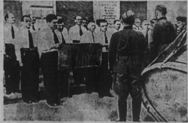
Подвиги сербский народ, фашистские варвары уничтожают все памятники его национальной независимости. На снимке: гитлеровцы снимают мемориальную доску, установленную в Сараеве, как символ национального освобождения сербов.

Газета «Джумхурет» пишет, что фактором, объединившим СССР и Англию, является не вражда к германскому народу, а вражда к агрессивной гитлеровской Германии. После разгрома Гитлера не будет препятствий для заключения мира с германским народом.