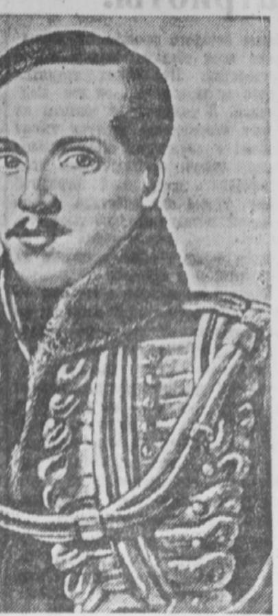
«Смотри, как умирают люди, И мстить учись...» (Баллада, 1830).

Так же трогателен тип матери, делящей с детской колыбелью мечту о силе, храбрости, войне, «богатыре с виду», жизнь которого отдала битвам, родине и воле. Для самого Лермонтова понятия родина и свобода были неразрывны. Свобода народа, знал поэт, куется в битвах, в трудах и подвигах. Лермонтов с любовью воспевал борьбу с тираниями (повесть «Вадим»), героическую борьбу народов за свою независимость («Мамалбай» и др.). Великий русский поэт, он был другом всех, кто терпел гонения, кто задыхался в неволе (драма «Испанцы», поэма «Боярин Орша»). Исключительно метко в творчестве Лермонтова затаилась идея произведений, посвященных отечественной войне 1812 года. Патриотизм Лермонтова ничто так мощно не проявлялся, как в его живом