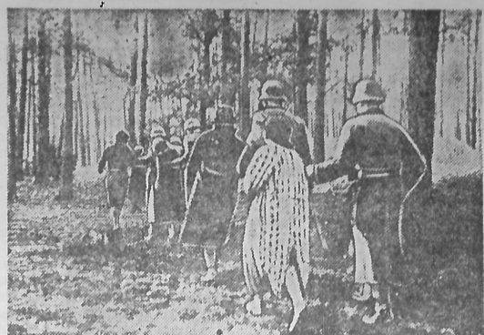
Гитлеровцы истребляют польский народ. На снимке: агенты гестапо ведут на расстрел группу из чехи новопольских польских женщин. Фотохроника ТАСС.

По официальным данным, за последние четыре недели над Англией появилось менее 300 германских самолетов. Это число меньше того числа английских бомбардировщиков, которые участвовали в налетах на Германию только в одну ночь на 15 августа.