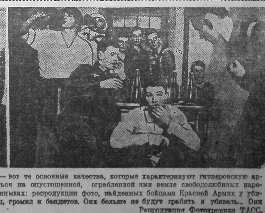
Разврат, разнузданное пьянство, обжорство, грабеж, мародерство — вот те основные качества, которые характеризуют гитлеровскую армию. Фашистские псы любят на добрую память фотографироваться на опустошенной, ограбленной ими земле свободных народов, пытаясь запечатлеть на снимках свое звериное лицо. На снимках: репродукция фото, найденных бойцами Красной Армии у убитых фашистских воинов. На нас глядят злые, наглые лица пьяниц, гомек и бандитов. Они больше не будут грабить и убивать. Они больше не будут заниматься.