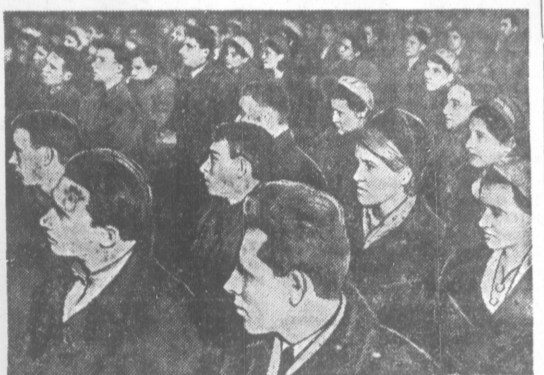
Антифашистский митинг молодежи в Ворошиловске. В зале митинга.

Мы еще теснее сплотим свои ряды вокруг советского правительства, вокруг большевистской партии. Наш острый лезет сегодня — все для победы над врагом! Кровь замученных братьев и сестер вызывает к мщению. Слезам обездоленных детей требуют расплаты.