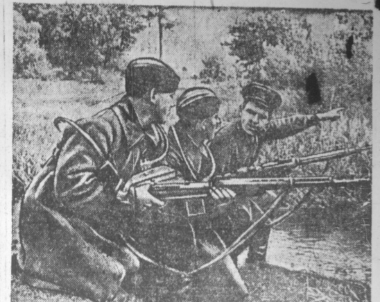
Ожесточенные сражения на Западном направлении.