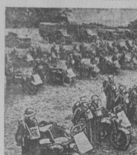
Соединение мотоциклистов в Англии охраняет побережье.