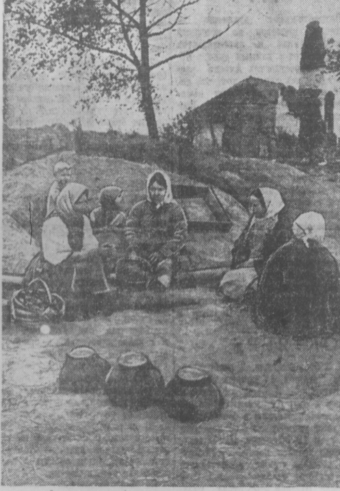
Там, где бьювались немецко-фашистские орды. На снимке: жители деревни Д. у своих жилищ, разрушенных немцами.

Старший полковник К. Буковский. Мало-Ярославское направление. («Красная Звезда» за 28 октября).