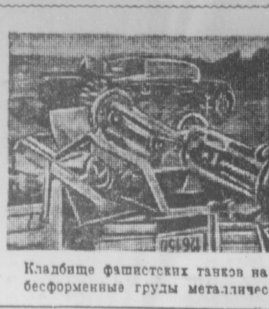
Кладбище фашистских танков на одном из участков Ленинградского фронта. Героически защитники города Ленина умеют превращать в бесформенные груды металлического лома военную технику немецко-фашистских головорезов.

Наша часть стойко удерживает рубежи. Противник недавно ночью пытался в одном месте сгруппировать крупные силы пехоты, чтобы с раскатом бросить ее в атаку на нас. Пыль врага была разогнана. По месту скопления вражеской пехоты наши артиллеристы и пулеметчики открыли губительный огонь.