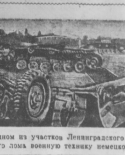
Кладбище фашистских танков на одном из участков Ленинградского фронта. Героически защитники города Ленина умеют превращать в бесформенные груды металлического лома военную технику немецко-фашистских головорезов.

Утром, по данным разведчика Ярошук, советская артиллерия уничтожила все огневые позиции врага.