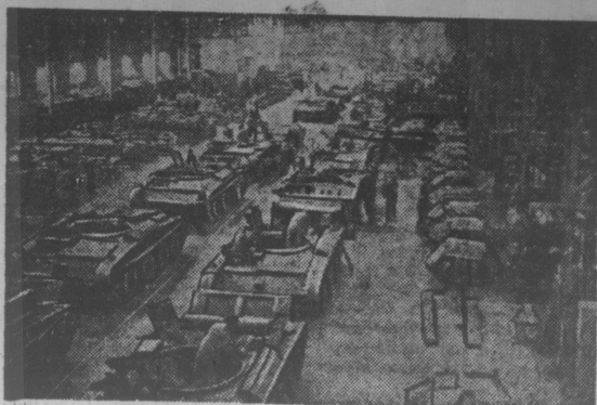
На военных заводах Англии. — Массовое производство танков.