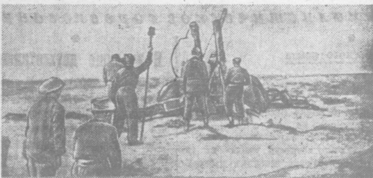
Военные действия в Ливии. Английская артиллерия обстреливает вражеские позиции.

Каждый танк, каждый самолет и орудие, которые только могли быть предоставлены Англией, несмотря на ее неотложные потребности на других фронтах, отправляются в Россию. Русским, несомненно, известно об этой помощи. Однако, она настолько незначительна по сравнению с тем, что делают сами русские для дела объединенных наций, что союзные народы должны предпринять нечто большее. Большие надежды возлагаются на заявление, содержащееся в коммюнике по поводу англо-советского договора. Это заявление гласит, что между обеими сторонами достигнута полная договоренность относительно неотложных задач союзника второго фронта в Европе в 1942 году».