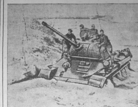
Первый Белорусский фронт. Переправа танков через водную преграду.