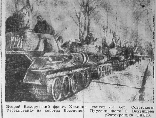
Второй Белорусский фронт. Колонна танков «20 лет Советского Узбекистана» на дорогах Восточной Пруссии.