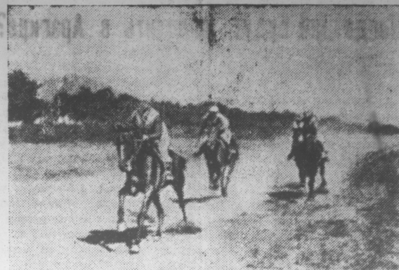
На Пятигорском ипподроме каждое воскресенье происходят скаковые испытания лошадей. На снимке: жеребец «Комик» из конюфермы к.з. «Красный партизан» Черкесского р-на подводит на скачках к финишу.