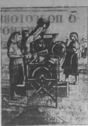
В колхозе им. Кагановича, Молодского района развернулась подготовка к осеннему севу.

В воскресенье, 12 августа, когда на хлебонавозе работало более 60 автомашин, из колхоза «10-й Октябрь» пришлось отозвать автомашину, так как там на токах, не оказалось намолоченного зерна.