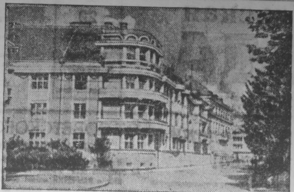
Закарпатская Украина. Уголок Сталинградской набережной в Ужгороде.