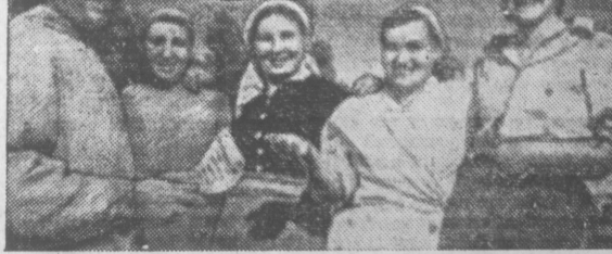
Бригада паяльщиков жестяно-баночного цеха Ставропольского мясо-консервного комбината, рассмотрев технологию работы, высвободила двух рабочих. Бригада выполняет ежемесячное задание на 180-200 процентов.