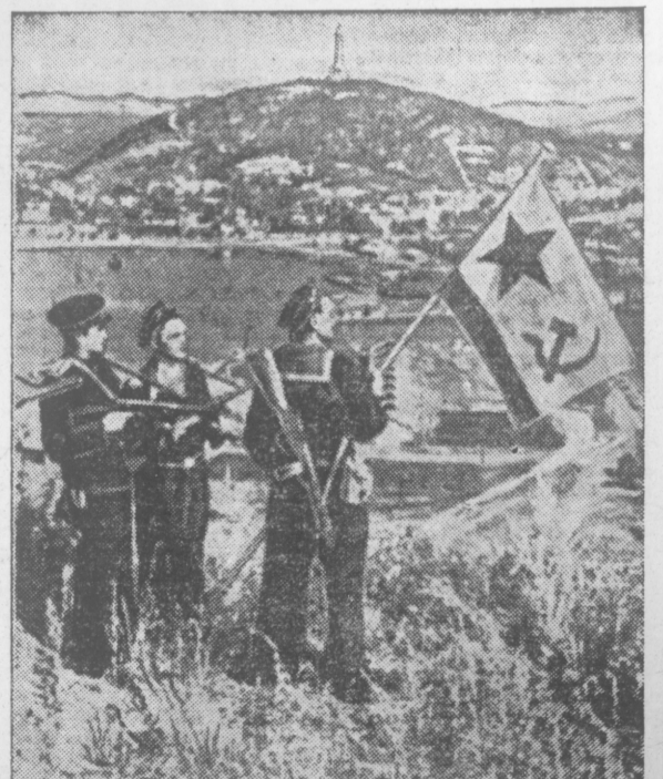
Моряки Тихоокеанского флота водружают Красное Знамя над Порт - Артуром