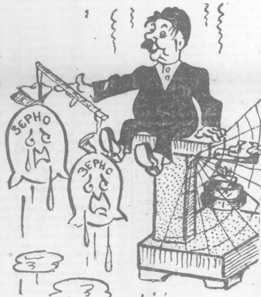
ТОЧНОЕ ВЗВЕШИВАНИЕ Рис. Дм. ШЕВЦОВА.

Весовщик колхоза «Магистроград», Александровского района, взвешивает поступающий из-под косы хлеб при помощи полуметровой палочки.