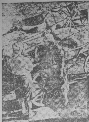
На Солдатско-Александровском заводе. Колхозники привезли хлеб в фонд Победы.