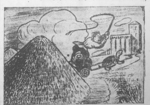
Если лезим с возом, Будут хлеб возить с гумна. То к морозам и метелям Не управится сполна.

В колхозе им. Ворошилова, Старо-Марьевского района, скопилось на токах 2400 пудов хлеба. На его транспортировке государству занята одна безтарка