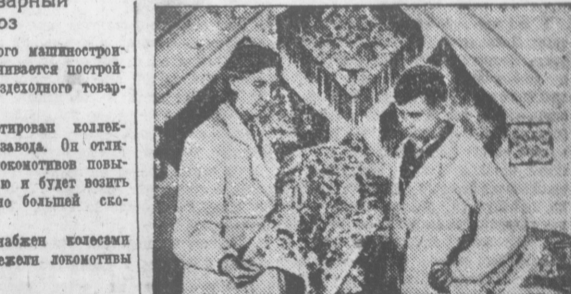
Завод стекол оловка в городе Гусь Хрустальный, Владимирской области, выпускает для населения красивые настоящие дорожки, салфетки, абактуры и другие изделия, вырабатываемые из стекла, оловка.