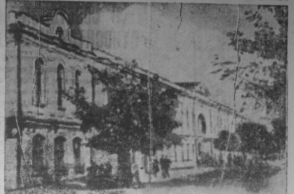
гор. СТАВРОПОЛЬ. Знание Крае водческого музея.

ОТТАВА, 3 октября. (ТАСС). Как сообщает агентство Канаден-пресс, в настоящее время в Канаде бастует около 18 тысяч рабочих, причем ожидается, что число бастующих в скором времени возрастет до 30 тысяч, включая 8 тысяч шахтеров в Западной Канаде. 10 тысяч рабочих завода компании Форда в Виндзоре бастуют 21 день, требуя заключения нового коллективного договора.