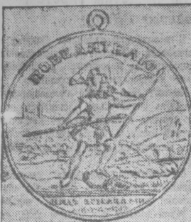
Этой медалью награждались участники исторической битвы при Кунерсдорфе, предвещавшей падение немецкой столицы в 1760 году.

Наш боевой путь начался в грозные дни осени сорок второго года, под Сталинградом. Развив крупными немецкими силами, мы пошли вперед, все ближе и ближе к фашистскому логову. С тех пор каждый день сопровождал нас боевые успехи, предвещавшие великого торжества советского оружия.