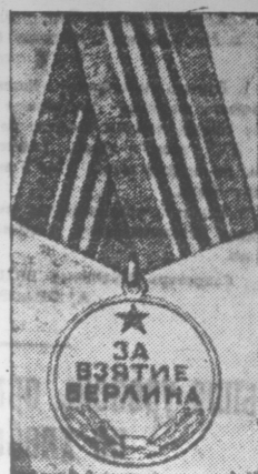
Этой медалью награждаются все воины, участвовавшие в боях за Берлин в 1945 году.

Бывший директор Ставропольского тринтозавода