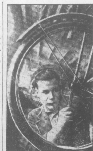
РИГА. Сборка велосипедов на восстановленном и пущенном в ход велосипедном заводе «Красная звезда». В 1946 году завод «Красная звезда» даст стране 100.000 велосипедов.

Старший научный сотрудник ВНИИО В. КУХАРЧУК. Кандидат биологических наук А. ЛОПЫРИН.