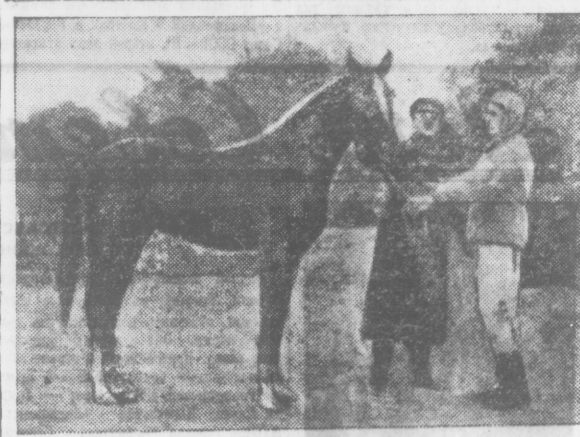
НА СНИМКЕ: Русский араб «Русалка». В 1944 и 1945 гг. установила мировые рекорды на дистанцию в 1200 метров (Терский конзавод).

Рекорды зарегистрированы официальной комиссией, специально приезжавшей из Москвы.