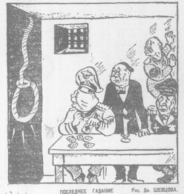
ПОСЛЕДНЕЕ ГАДАНИЕ Рис. Дм. ШЕВЦОВА.

Ответственный редактор О. А. ЗДОРОВЕНКО.