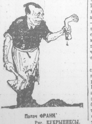
Палач ФРАНК. Рис. КУБЫРИНСКИ.