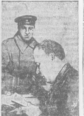
В Минводский горком ВКП(б) ежевечерне приходят коммунисты, демобилизованные из Красной Армии...