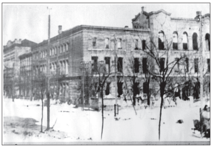
Здание главного учебного корпуса института, разрушенное немецко-фашистскими оккупантами при их отходе. (Вид с угла ул. Мира и пер. Зоотехнического). 1943 г.

Жители нашего двора на улице Калинина быстро собрали вещи и предприняли попытку пешей эвакуации в южном направлении, но, не зная точного маршрута, наткнулись за пределами города на наступавшие немецкие части. Пришлось вернуться домой в город, куда уже входили оккупанты. Нас, семью советского прокурора, с риском для своей жизни укрыли позже жители села Надежда. В первый же месяц «нового» немецкого порядка в городе