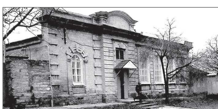
● Здание бывшего Пушкинского училища на улице Некрасова.

Какие теплые, ласковые письма присылал он мне оттуда! — продолжает собеседница. — Доченька, писал, как я скучаю за тобой. А еще хочу, чтобы ты посмотрела этот Львов, он очень красивый. Вот вернусь, соберемся и приедем сюда вместе. Вернулся он в Ставрополь только в конце 1945-го. Позади была война, в пекло которой он попал в первый же ее день. Стал работать участковым врачом-терапевтом в одной из городских поликлиник. Умер в 1961 году. Похоронен на Даниловском кладбище.