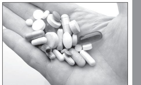
Подготовила Наталия КОЛЕСНИКОВА.