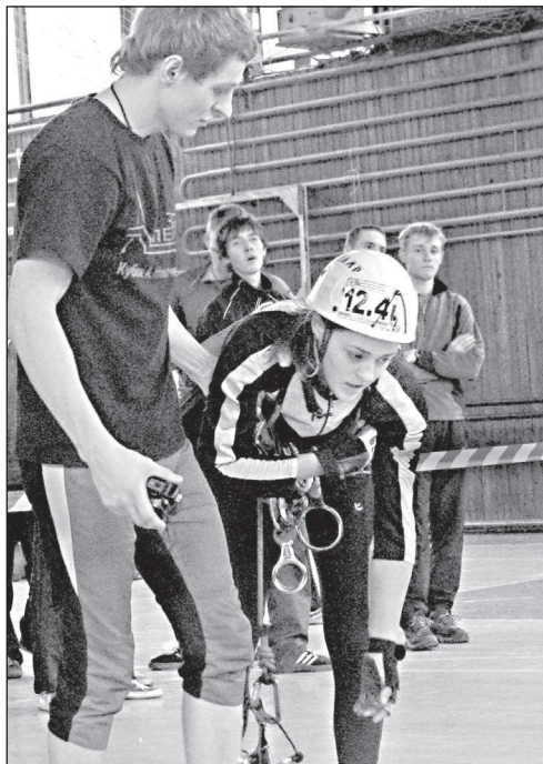
● Моменты соревнований.

на веревке, за секунду зацепили несколько страховочных карабинов - и быстро-быстро через весь зал вверх по веревке. Под самой крышей, куда и снизу-то смотреть страшно, опять перешелкнули карабины, навели веревочные перилы, навели веревочные перилы, навели веревочные перилы. Здесь снова надо мгновенно разобраться с убойной карабином, веревкой - и вверх по искусственной отвесной скале. Затем снова спуск и снова подъем под самую крышу: то просто на руках, то с помощью специальных приспособлений - понтина или жумара. Нагрузки такие, что каждый второй участник, добежав до финиша, падал и минутную другую не мог подняться. Но зато физическое развитие спортивного туризм обеспечивает великоколепно. А поскольку участники состязаются на параллельных трассах, то и эмоциональный накал в зале высочайший. После индивидуальных последовали состязания в связках, а затем сложнейшая работа на трассе демонстрировали команды: в каждой три парня и одна девушка. Все сумми-