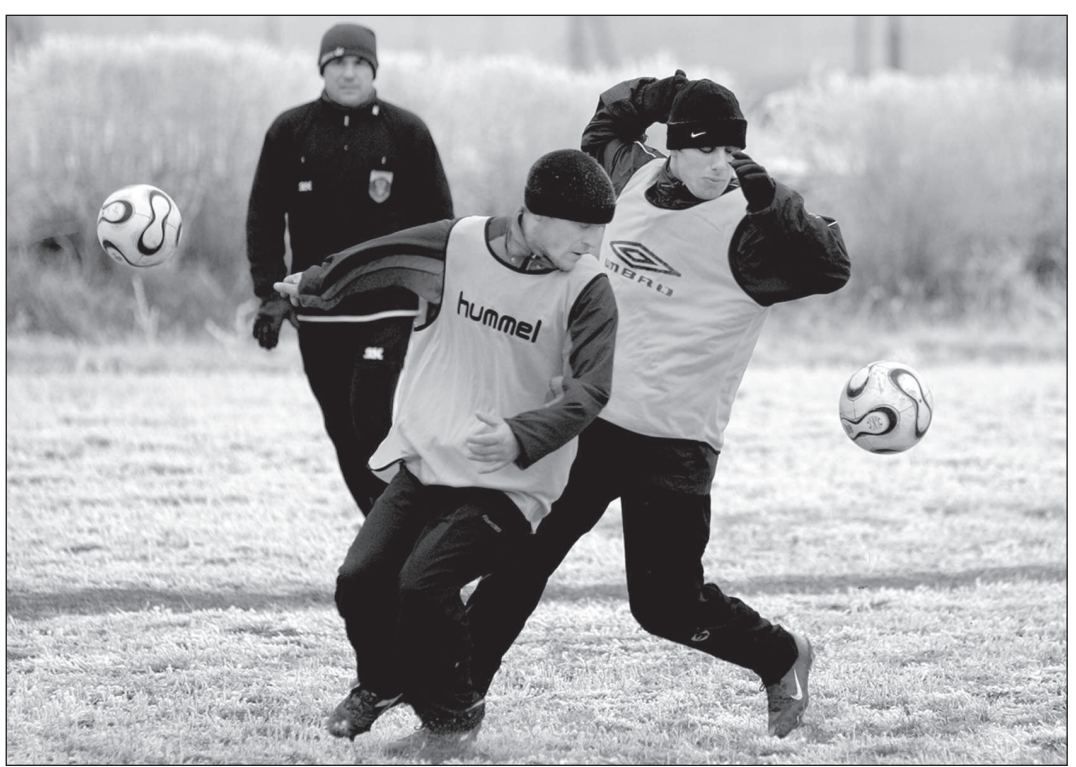
В пылу борьбы на поле оказалось сразу два мяча...

(Окончание на 4-й стр.).