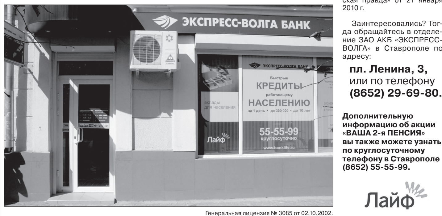
Генеральная лицензия № 3085 от 02.10.2002.