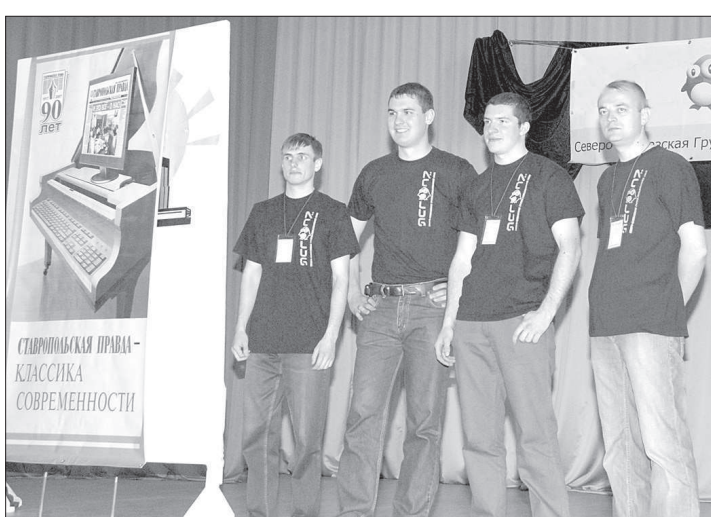
Фестиваль Linux в Ставрополе.

Когда в 1991 году финский студент Линус Торвалдс разработал операционную систему Linux, он вряд ли предполагал, что станет серьезным конкурентом «империи» Била Гейтса и его продукт найдет миллионы пользователей во всем мире.