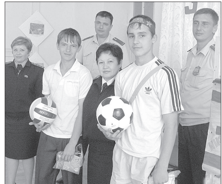
Особенно радовались мячам мальчишки.

АСОБРАЛИСЬ здесь, то есть в детском доме села Преградного Красногвардейского района, хозяйва учреждения (воспитанники и педагоги детского) и их гости - сотрудники районного отдела УФССП по краю. Накануне Международного дня защиты детей судебные приставы с подарками и угощением приехали к ребятишкам, чьи мамы и папы посчитали, что воспитание собственных чад - непосильный и ненужный труд.