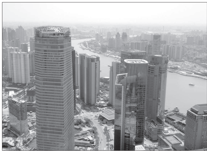
● Экономическая столица КНР - Шанхай.