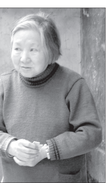
● Вся история КНР прошла на ее глазах.

скоростью 120 километров в час (разрешенная максимальная скорость в левом крайнем ряду магистралей КНР) несется в сторону Шанхая. Передо мной на раскромканом откидном столике стоит, колеблясь меньше, чем в поезде, стакан воды. А я тем временем записываю в блокнот, примощенном на колени, свежие впечатления. Пишу, не замечая скорости. Занятная деталь: китайские водители очень любят сигнализировать, особенно во время обгона или опережения. То ли здороваются так, то ли стараются дополнительно привлечь внимание... Транспорт - самый разнообразный и вполне современный. Носятся хонды, ниссаны, бьюики, фольксвагены, китайские марки, в том числе и трехколесные легковушки и грузовички. В воздухе - аэробусы и боинги. Кстати, на перелете из Пекина в Гуанчжоу наш самолет был забит под завязку, а очередь перед взлетной полосой