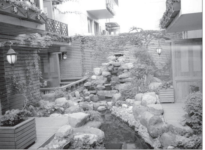
● Пекин. Гостиничный двор.

денги кило свинины до 100 рублей, рис - 12-14 рублей за килограмм, хлеб - рубль по два-два с половиной, макаронные изделия от пяти до 50 рублей за 400-граммовую упаковку. По виду (прочитать трудно а спросить не у кого) самые дорогие макароны - из пшеничной муки. Ну а самые дешевые - те, что очень походили на всякие «обеды» быстрого приготовления. Несколько слов о спиритном: водка ценится и в 25 и в 1000 рублей (в бутылки - клубок змей, какое-то сооружение из корешков и еще чего-то). Градусов - больше пятидесяти. Но на вкус - как бы это сказать, чтобы не обидеть производителя... А вот вина нам весьма и весьма понравились. Но и цена соответствует качеству: поллитровая бутылка прилично-сухого красного вина - 900 рублей. Табачные изделия недешевы. В среднем - 100 рублей пачка.