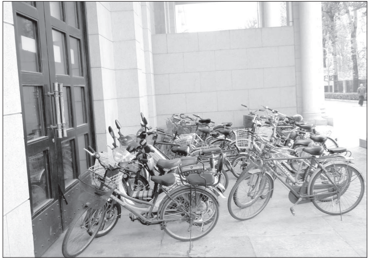
● Парковка в пекинском ресторане «Москва».