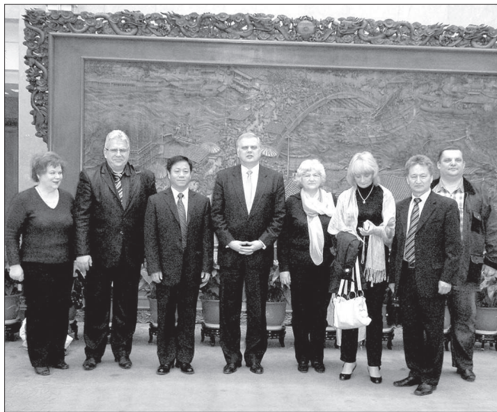
● Встреча в МИДЕ.