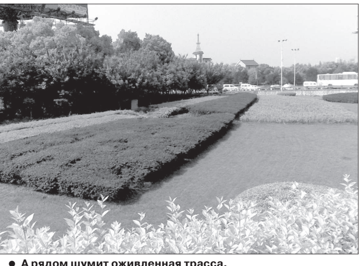
● А рядом шумит оживленная трасса.