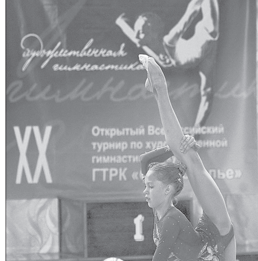
Открытый Всероссийский турнир по художественной гимнастике на Кубок ГТРК «Ставрополь»

Два последних дня турнира для этих 68 гимнасток выдалась жаркими. И в прямом, и в переносном смысле: на улице несуетная жара, в зале — духота, а тут еще на ковре приходится выкладываться до предела. Иначе шансов взойти на пьедестал или даже постоять рядом с ним не будет.