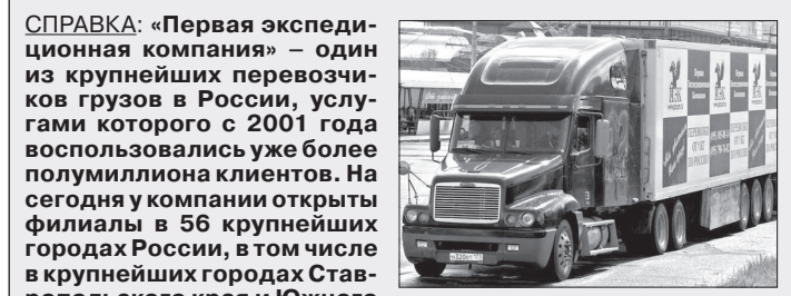
СПРАВКА: «Первая экспедиционная компания» — один из крупнейших перевозчиков грузов в России, услугами которого с 2001 года воспользовались уже более полумиллиона клиентов. На сегодня у компании открыты филиалы в 56 крупнейших городах России, в том числе в крупнейших городах Ставропольского края и Южного федерального округа.

Д О НАСТОЯЩЕГО времени, как свидетельствует статистика, данная дорога оставалась одной из самых аварийных магистралей края. В сутки по ней перемещается в среднем около девяти тысяч автомобилей, в результате таких нагрузок довольно продолжительный участок дороги практически разрушился.