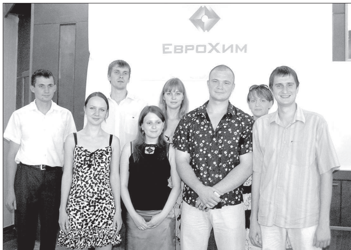
● Молодые специалисты - будущее «Невинномысского Азота».