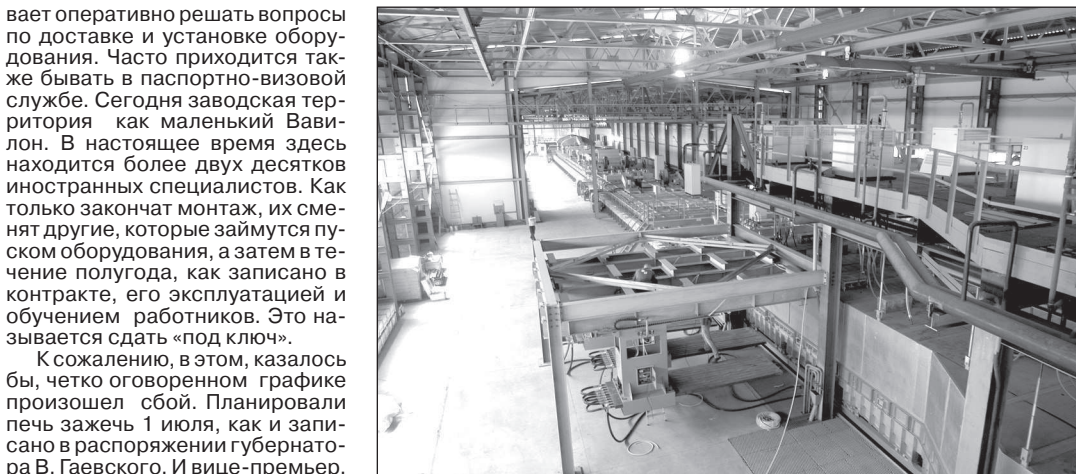
● Линия листового стекла в ожидании пуска.

вает оперативно решать вопросы по доставке и установке оборудования. Часто приходится также бывать в паспортно-визовой службе. Сегодня заводская территория как маленький Вавилон. В настоящее время здесь находится более двух десятков иностранных специалистов. Как только закончат монтаж, их сметают другие, которые займутся пуском оборудования, а затем в течение полугода, как записано в контракте, его эксплуатацией и обучением работников. Это называется сдать «под ключ».