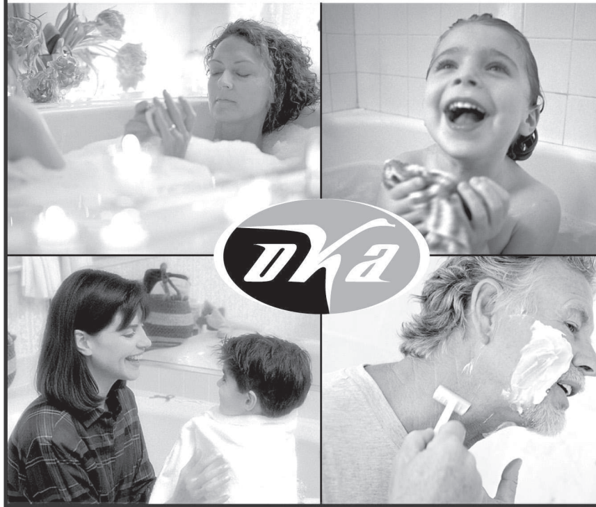
ВОДОНАГРЕВАТЕЛЬ «ОКА» - ПОБЕДИТЕЛЬ КОНКУРСА «100 ЛУЧШИХ ТОВАРОВ РОССИИ»