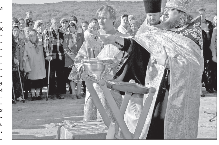
В. НИКОЛАЕВ.

ПРАВОСЛАВНЫЙ приход в 1993 году, но церкви не было, и долгое время верующие проводили богослужения в переоборудованном помещении. Шесть лет назад началось строительство нового храма, его окончание запланировано на будущий год. Чин освящения куполов совершил проректор Ставропольского духовного семинария, архимандрит Роман (Лукин). После того как церковь была украшена сверкающими на солнце куполами, в небо взмыли белые голуби, символизирующие мир и несущие всему свету символическое послание, что одним