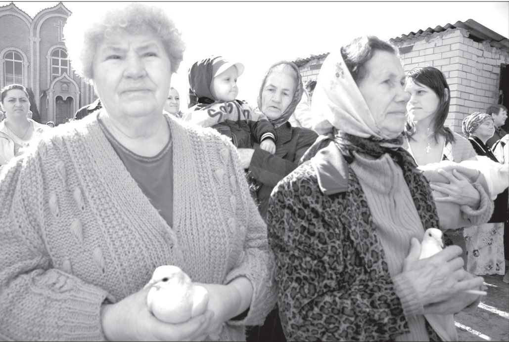
Вчера в селе Верхнерусском Шаповоского района состоялось освящение и установка куполов на строящийся храм святителя Тихона.