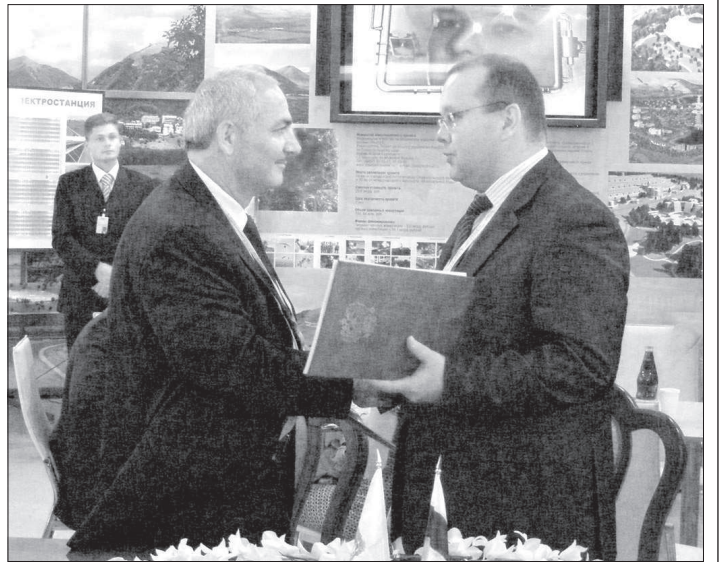
Глава Невиномыска К. ХРАМОВ и президент группы компаний «Северо-Кавказский Агрохим» А. КАРАКОТОВ.

Президент группы компаний «Северо-Кавказский Агрохим» Аслан Каракозов выразил уве-