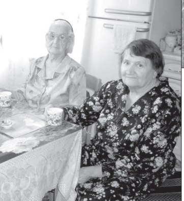
Подруги обсуждают празднование Дня пожилых людей-2009.

ним лавочка. На это место оценить конкурсы самостоятельно члены частной организации пенсионеров со всей округи. Так отмечают все праздники и дни рождения. На стол, по старинке, ставят «у кого что есть». Любят наряжаться и разыгрывать сценки из прошлых лет.