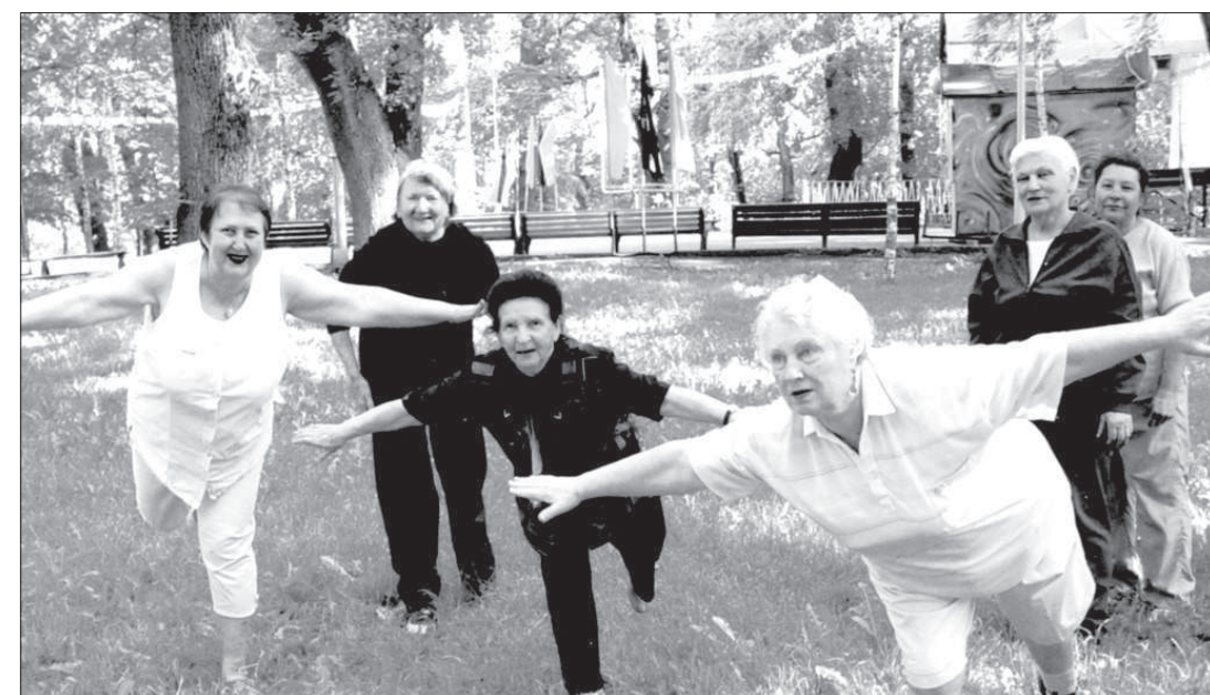
Зарядка в группе здоровья (парк «Центральный»).

Обычно пожилыми называют тех, кто достиг пенсионного возраста. В нашем крае проживают 659,3 тысячи людей, вышедших на заслуженный отдых. Без малого четвертая часть всего Ставрополья. Пенсионеры XXI века не сидят без дела. Они критически оценивают каждый прожитый день своей жизни. А «профессиональный праздник» для многих станет лишь апогеем активности.