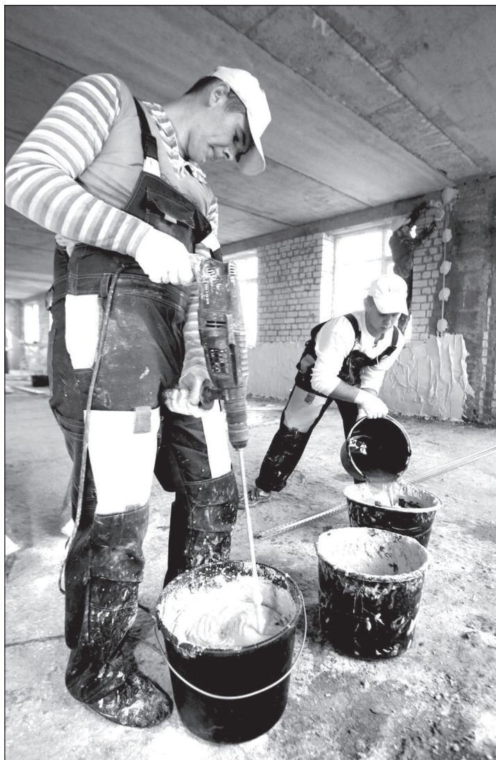
Как и на кухне, штукатурку не обойтись без миксера.