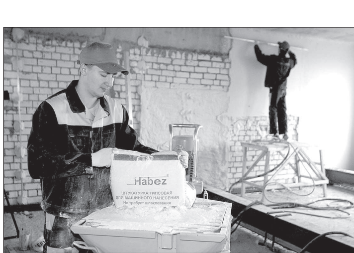
Идет загрузка гипсовой смесью станции по нанесению штукатурки и заливки пола.