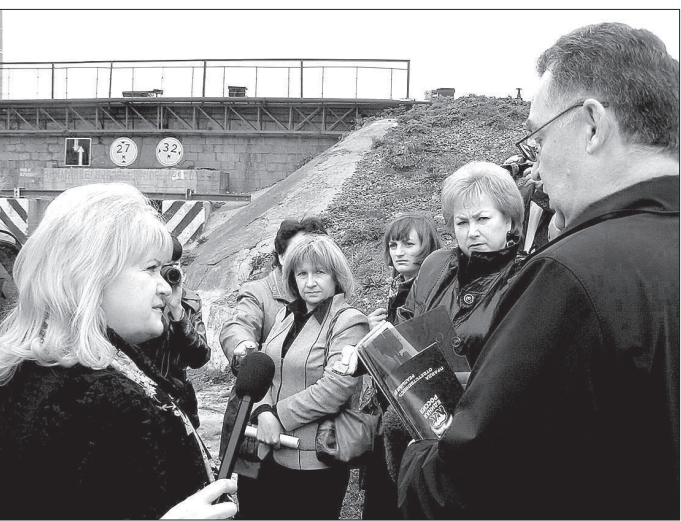
Надежда Герасимова в ходе своей рабочей поездки ознакомилась с проблемами промышленного центра края.

В Невинномысске с рабочим визитом побывала заместитель председателя Госдумы РФ Надежда Герасимова