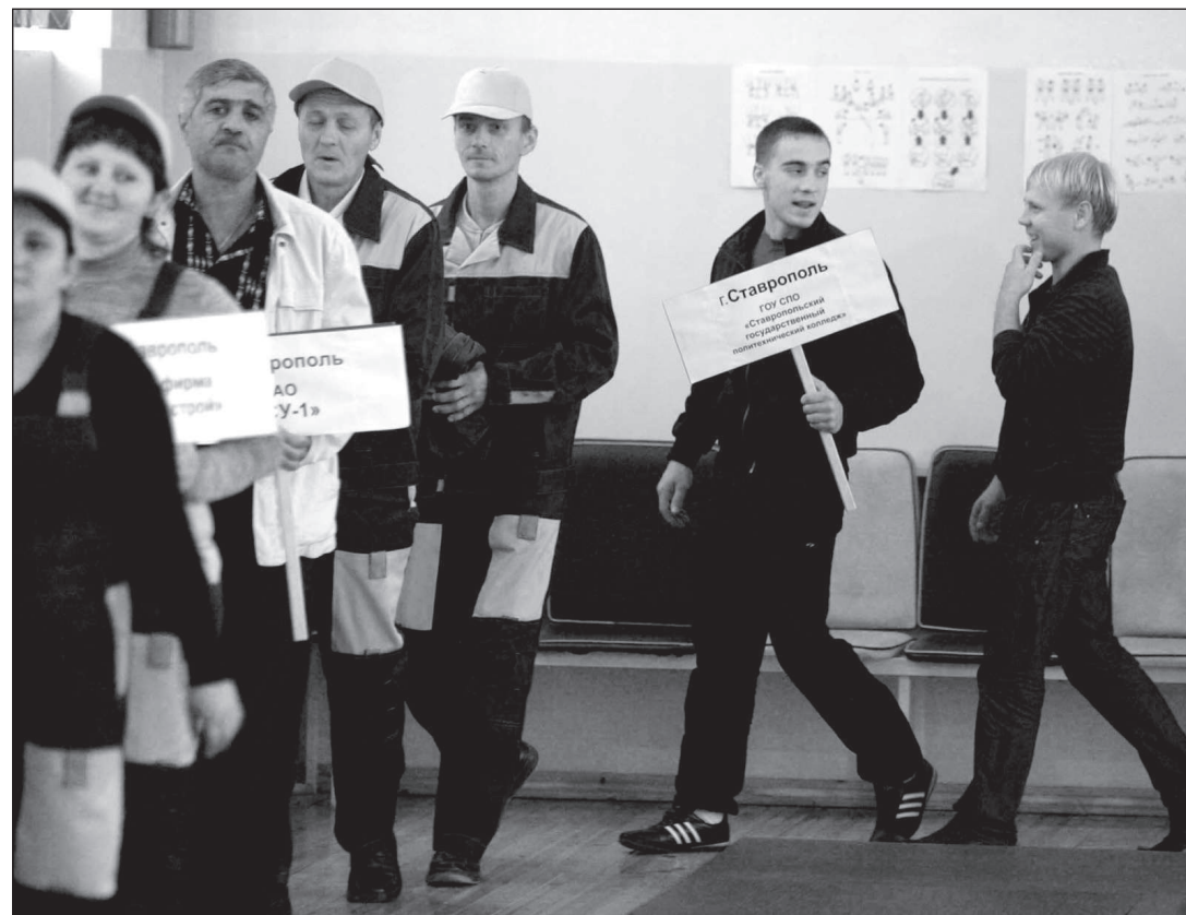
Марш участников конкурса.