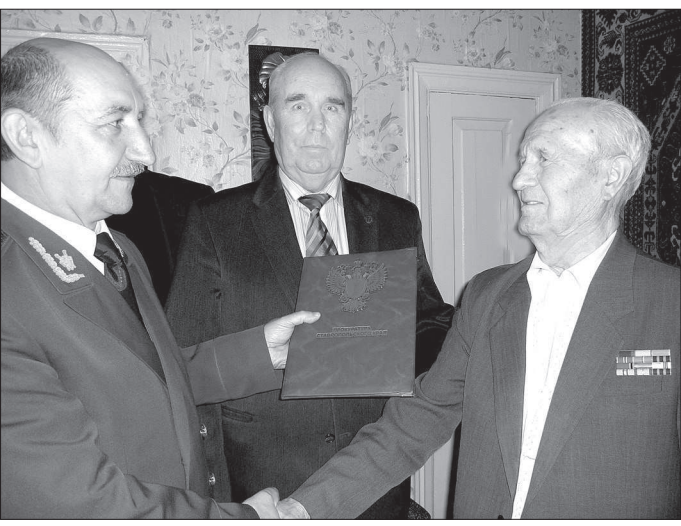
Благодарные ученики поздравляют юбиляра.