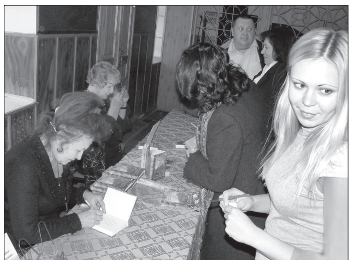
● Очередь за автографом.

В РАЙОННОМ Доме культуры собралась сельская интеллигенция, чтобы послушать приехавших в гостиницу ставропольских поэтов, песенников, полюбоваться выставленными в фойе картинами.